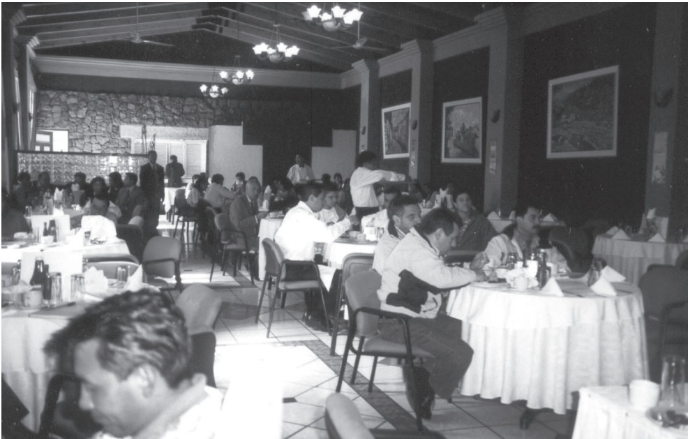
Encuentro con candidatos

Fuente: Encuentro con candidatos a alcalde y diputado de cinco partidos y movimientos políticos, medios de comunicación y organizaciones de la sociedad civil, organizado por la mesa departamental de Quetzaltenango el 11 de septiembre de 2003. Foto tomada por la autora.