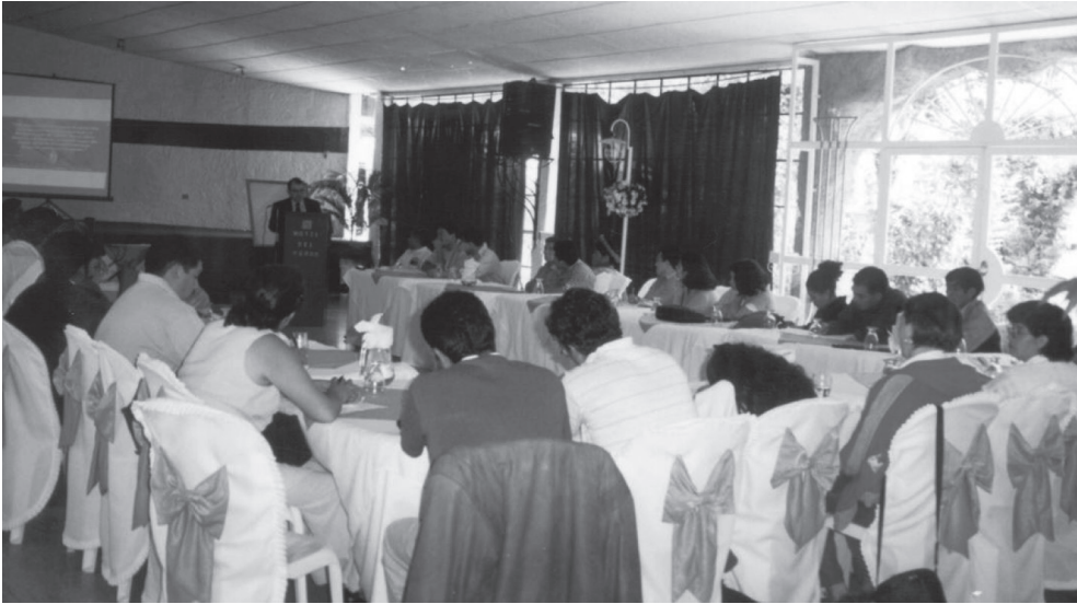
Asamblea de la mesa departamental de concertación de Huehuetenango

Fuente: Asamblea de la mesa departamental de concertación de Huehuetenango con la participación de representantes de la Comisión Presidencial sobre Descentralización y de la Comisión Presidencial sobre Derechos Humanos el 25 de abril de 2002. Foto tomada por la autora.